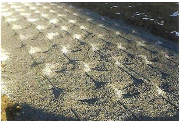
Eksempel på bygging av nytt infiltrasjonsanlegg.

Når anlegget er ferdigstilt, skal firmaet som søkte på dine vegne, be kommunen om ferdigattest. Ferdigattesten vil bli sendt til deg i posten. Du har et gyldig utslipp først når ferdigattesten er gitt, og saken blir da avsluttet hos kommunen.